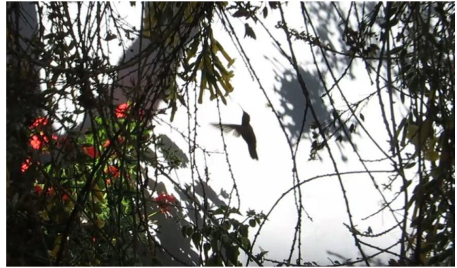
Soms wordt de kolibrie de schaduw van zichzelf