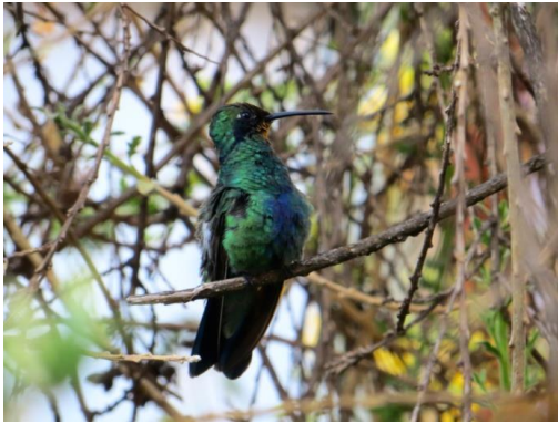
Zittend op een tak laat de kolibrie zich gemakkelijker fotograferen.